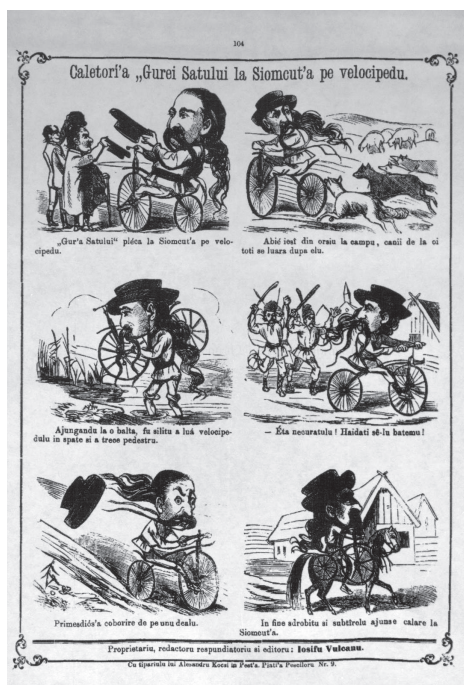
Fig. 2 – Călătoria Gurei Satului la Șomcuta pe velociped. „Gura Satului”, anul VII, nr. 26, 25 iulie/6 august 1869, p. 104.