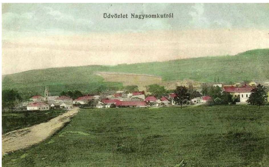
Fig. 1 – Carte poștală cu Șomcuta Mare, începutul secolului al XX-lea.